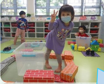
我們玩完玩具後，女工姐姐會幫我們清潔消毒。