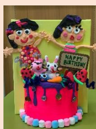
高班作品 「動物派對」