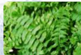
波士頓腎蕨 (Nephrolepis Exaltata)