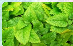
檸檬香蜂草 (Lemon Balm)