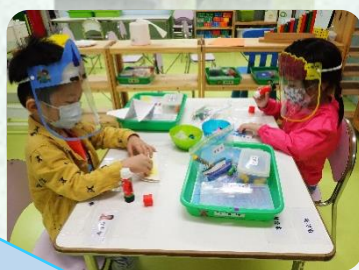
保持距離都玩得好開心！