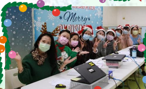
我們與高班的聚會