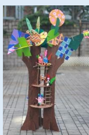
高班作品 「動物遊樂場」