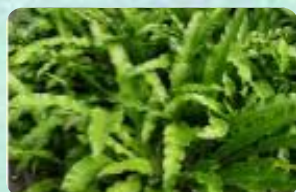
雀巢蕨 (Asplenium Nidus)