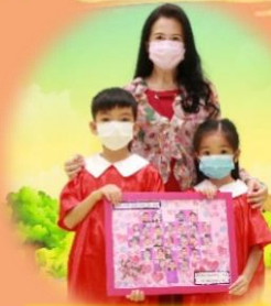
畢業生代表全體畢業生致送紀念品給幼兒園