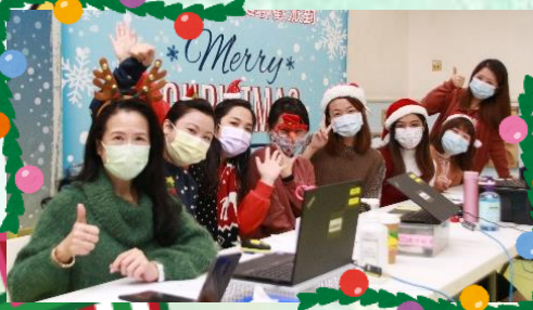
我們與幼初班及幼兒班的聚會