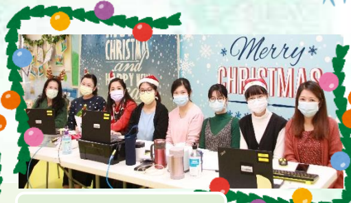
我們與低班的聚會