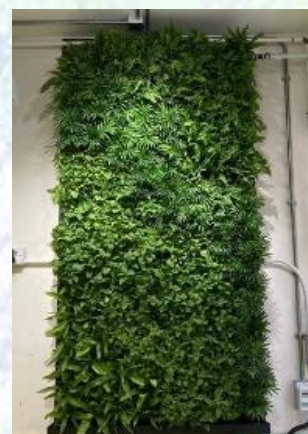
活動室 3 內實景