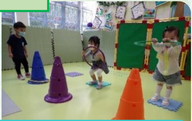
老師安排我們使用個別的體能器材，確保衛生！