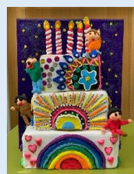
高班作品 「蛋糕樂園」