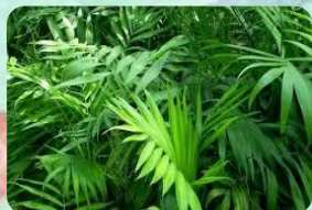
袖珍椰子 (Chamaedorea Elegans)